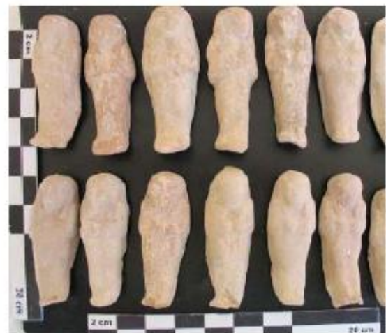
Figura 4. Ushebty. Tercer Período Intermedio.

En la cuadrícula H-6, a tres metros de profundidad se ha descubierto una estructura de edificio fabricado con adobe aparejado. Se ha excavado en la cuadrícula G-6 para descubrir más paramento de dicha construcción. Continúa bajo los niveles de la cuadrícula F-6.