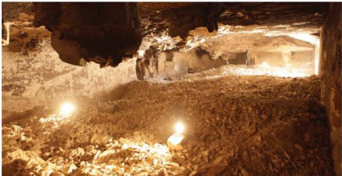
Figura 7. La capilla solar de la TA 28.

El inconveniente de esta roca es que, al desarrollarse en capas horizontales de diferente espesor, tiene una baja resistencia ante las per-