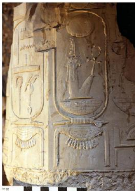
Figura 8. Columna de Amen-Hotep III. Procede de la capilla solar, TA 26.

La jarra es de tipología claramente ramésida. También se ha descubierto un bloque de caliza con relieves e inscripciones (n.º 956 del Libro-Registro de excavaciones), que revela el rostro del Visir Amen-Hotep Huy. Este bloque se ha unido con el n.º 339 del Libro-Registro de excavaciones, descubierto la campaña de excavaciones del año 2009. En la cuadrícula I-7, en el mismo nivel, hemos encontrado restos de un lecho de adobes muy degradado, con evidencias de haber sido utilizado para eviscerar y desecar un cuerpo durante el proceso de la momificación, junto con docenas de paquetes de lino conteniendo natrón. Se ha encontrado un ushebty de barro con el nombre de su dueño escrito con tinta roja: Pa (di)-Iry-Khonsu (probablemente del Tercer Período Intermedio). En ambas cuadrículas se ha instalado, en el hueco de la entrada a la capilla, la estructura de seguridad destinada a proteger contra un eventual colapso de la roca de la tumba, así como para instalar una puerta de acero a la entrada de la capilla. Se han encontrado numerosos fragmentos de ca-