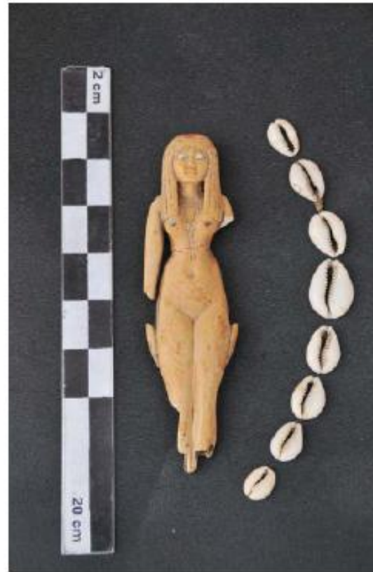
Figura 6. Estatua de concubina de difunto. Marfil. Tercer Período Intermedio. Registro de Excavación número 514.

Se han producido hallazgos de diferentes restos y estructuras arqueológicas, lo que ha exigido un cuidadoso trabajo de excavación y documentación, y producido la natural lentitud del trabajo emprendido, por lo que no se ha podido liberar el espacio total frente a la puerta de entrada. Por todas estas razones, la instalación definitiva de la puerta de hierro debió retrasarse hasta la campaña del año 2010. La estructura de construcción descubierta en la cuadrícula H-6 se ha cubierto con geotextil y ha sido protegida con adobes.