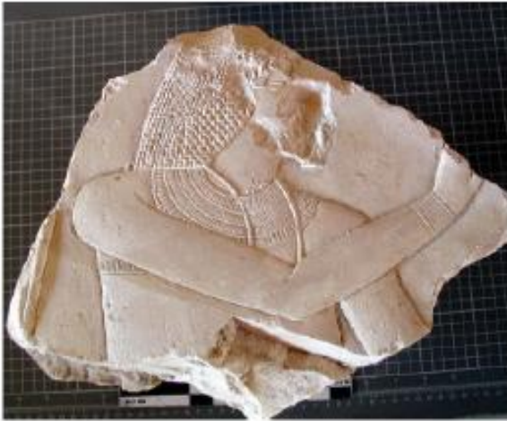
Figure 5. Estructura de adobes. Peño de la TA 28, Muro Oeste.

En las cuadrículas H-7 y G-7 se han descubierto restos dispersos de siete momias fragmentadas (Momias A-G). Se ha procedido a su documentación y levantamiento.