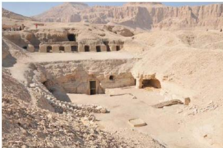
Figure 1. Tumba TA 28 del Visir Amen-Hotep Huy. Fotografía: Teresa Bedman.

La capilla transversal estuvo dotada en su tiempo de tres filas de diez columnas cada una, treinta en total, aparentemente todas de estilo papiriforme cerrado, para sujetar el techo. Hoy solo permanecen en pie dos de ellas, seriamente dañadas, mientras los fragmentos de las demás deben estar entre el cúmulo de los cascotes que cubren el suelo de la cámara