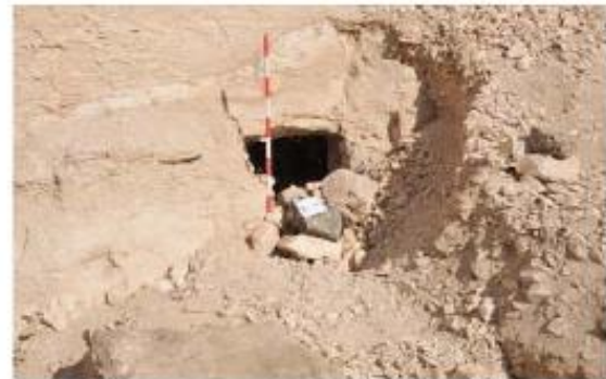
Figura 2. Tumbas secundarias en el patio de la TA 28.

Además, están localizadas hasta otras tres sin número de catalogación, dos en la pared sur y una en la pared norte del patio al aire libre.